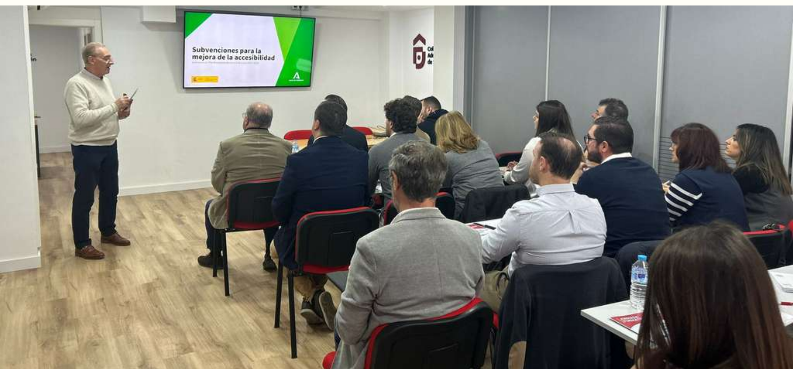
Imagen de las jornadas celebradas en la sede del Colegio de Administradores de Fincas de Jaén con la participación de la Delegación Territorial de Fomento, Articulación del Territorio y Vivienda de la Junta de Andalucía.