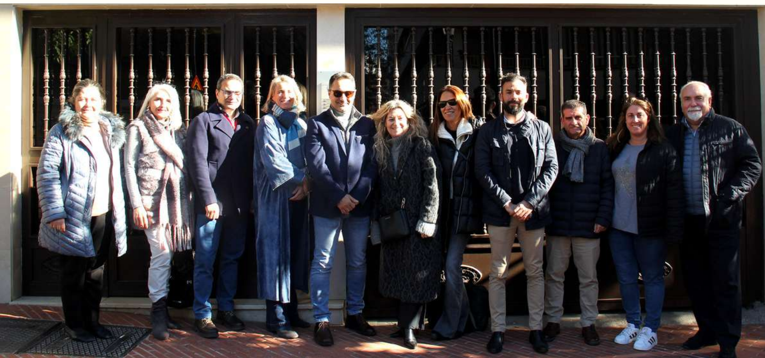
Miembros del COAF Huelva en la entrada de la nueva sede con mejores condiciones de habitabilidad, como nuevo hogar de los AF Colegiados/as de la provincia

Huelva- El Colegio Administradores de Fincas de Huelva ha celebrado su XIX Aniversario respondiendo a las nuevas necesidades de la institución y a su relación con la sociedad y desde el pasado mes de diciembre de 2023, el COAF estrenó nuevas oficinas en el corazón de Huelva, en el Paseo Santa Fe, 14, entreplanta.