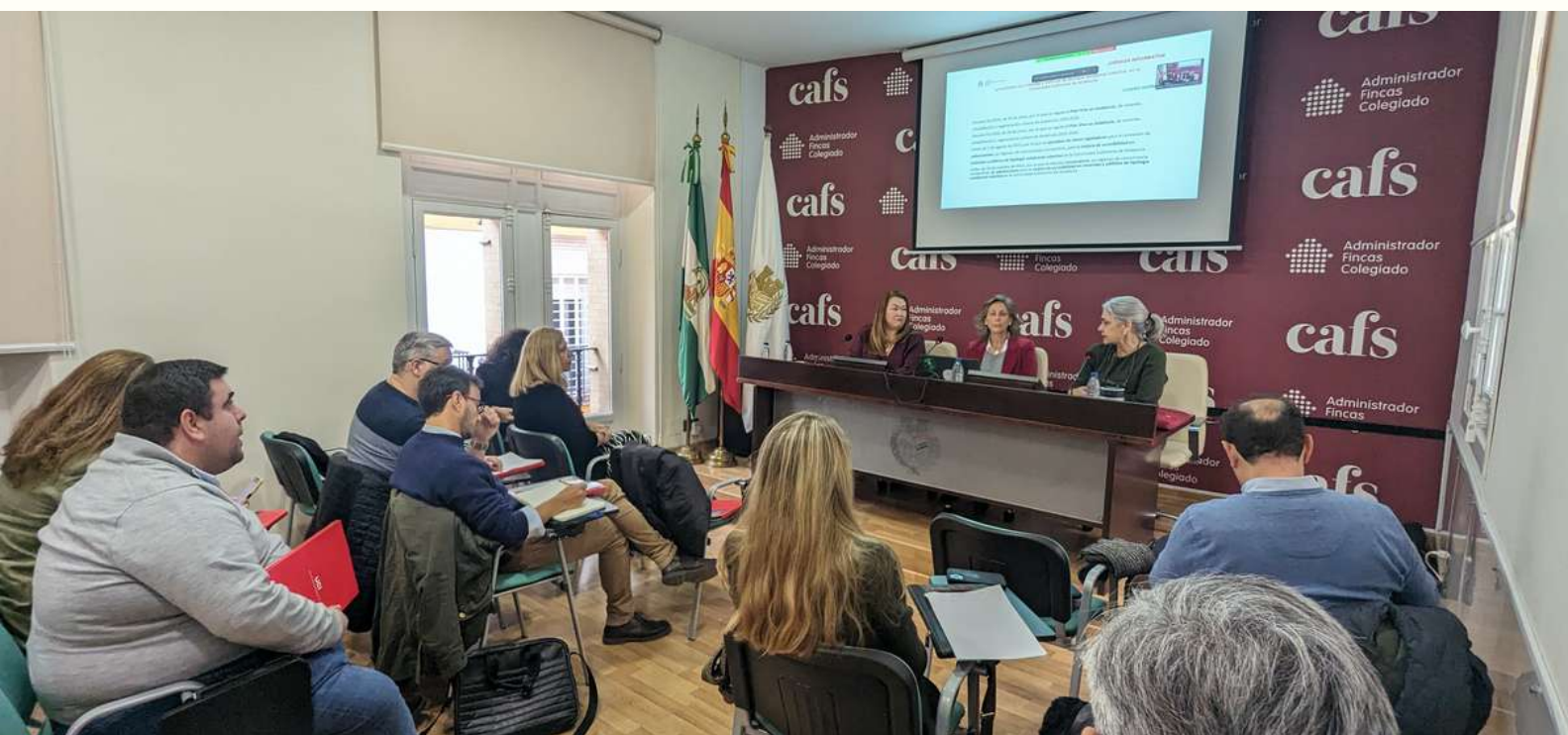
Imagen del taller impartido en la sede del Colegio de Administradores de Fincas de Sevilla con la participación tanto presencial como online de numerosos Administradores de Fincas Colegiados

Sevilla - El calendario formativo del Colegio de Administradores de Fincas de Sevilla arrancó con fuerza este año 2024, presentando un taller que tuvo lugar el pasado 26 de enero centrado en las ayudas para la accesibilidad y ascensores en las comunidades de propietarios.