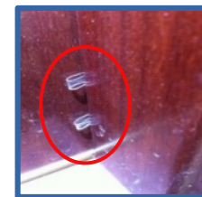
Testigos de papel / plástico