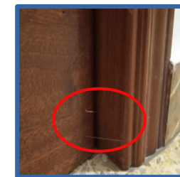
Hilo de silicona